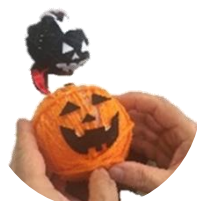
ハロウィン飾りづくり

コロナ予防対策をとりつつ、一緒に楽しく体を動かしませんか？次年度も教室開催のご相談、お待ちしております！